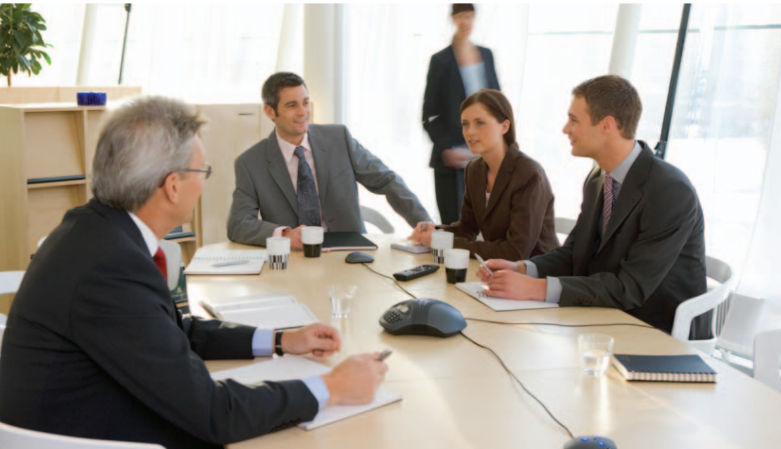
Conference phones for every situation